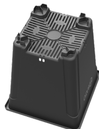
Nelikulmainen viljelyruukku 10 kevyt