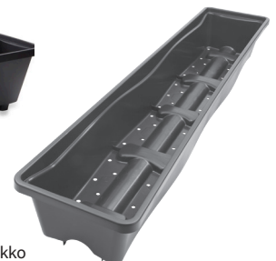
Wave Plus viljelylaatikko