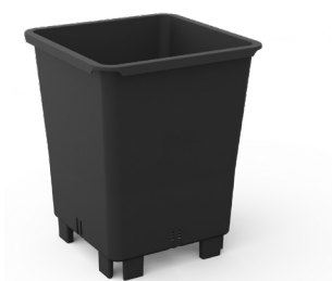
Nelikulmainen viljelyruukku 7